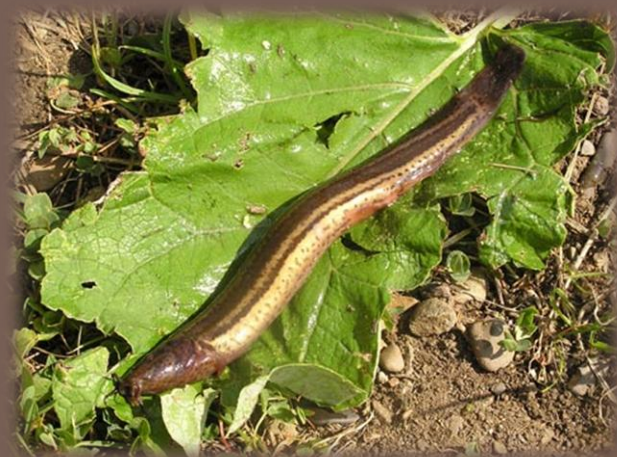
Čík európsky – celoročne chránený!