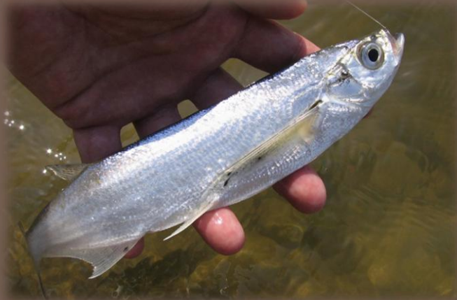
Šabl'a krivočiara ( Pelecus cultratus )