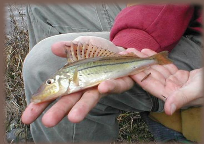
Hrebenačka pásavá (Gymnocephalus schraetser)