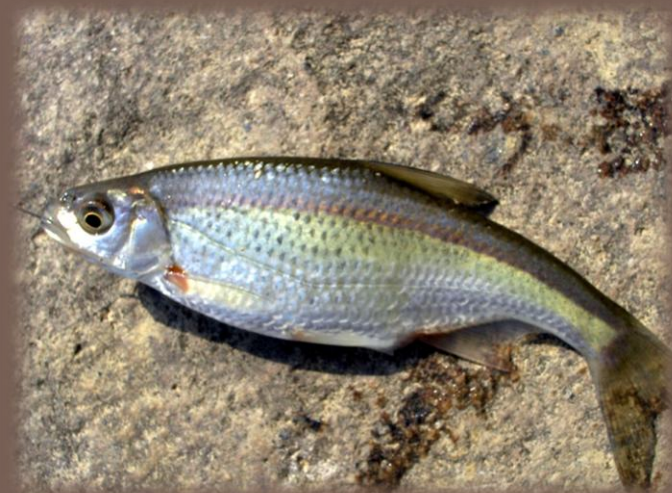
Ploska pásavá ( Alburnoides bipunctatus )