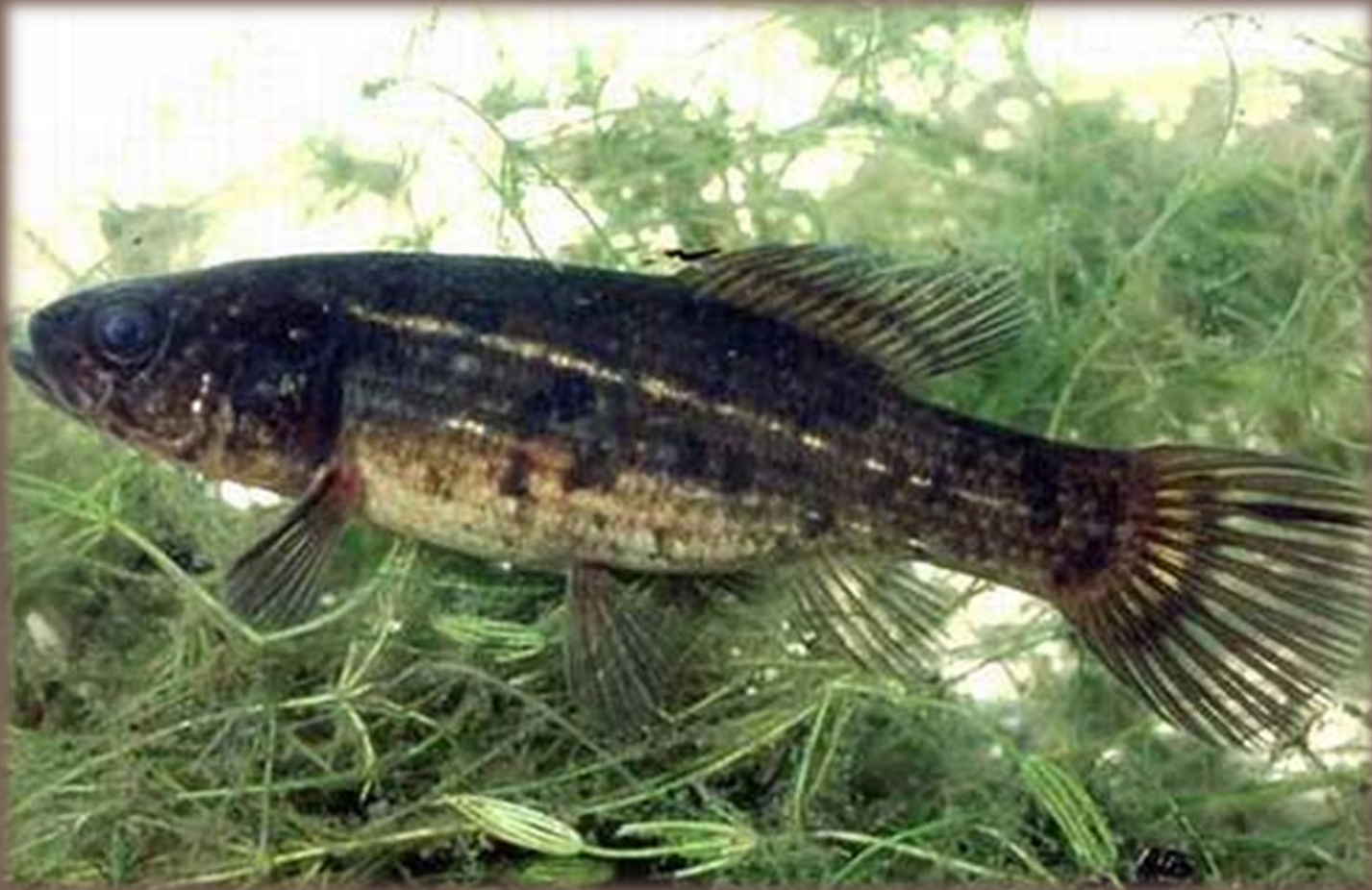
Blatniak tmavý ( Umbra krameri )