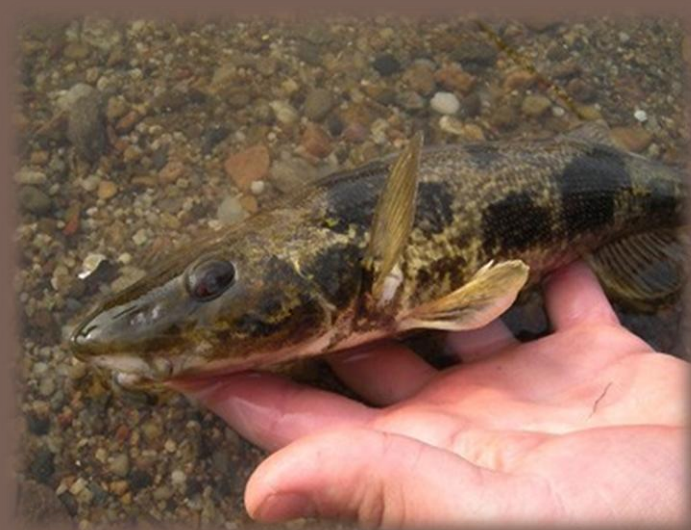
Kolok veľký (Zingel zingel)