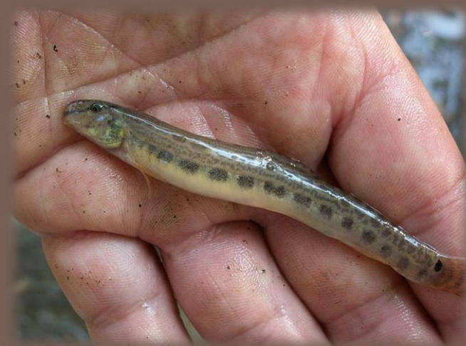
Píľ severný – celoročne chránený!