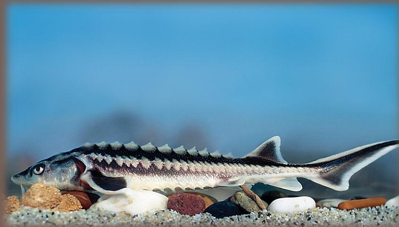
Jeseter ruský – celoročne chránený!