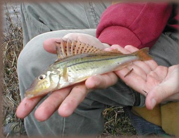
Hrebenačka pásavá – celoročne hájená!