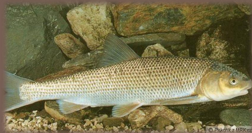
Plotica perleťová ( Rutilus meidingeri )