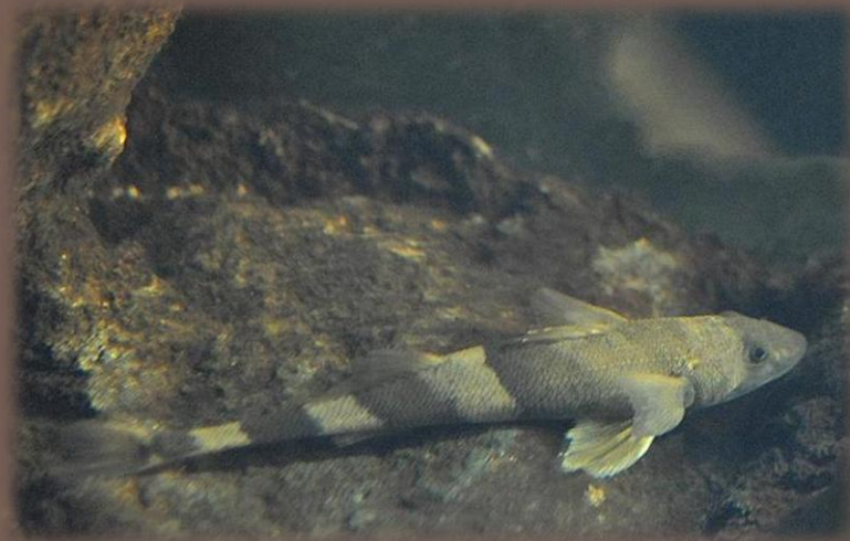
Kolok vretenovitý (Zingel streber)