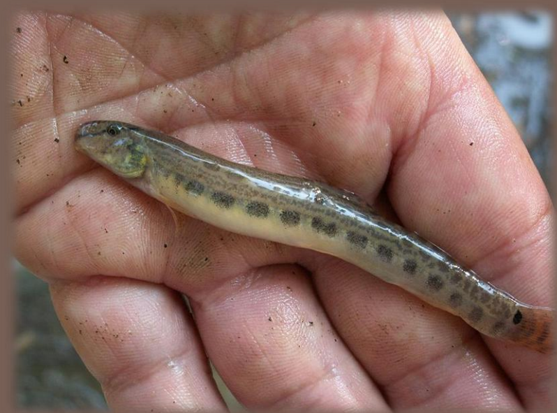
Píž severný ( Cobitis taenia )