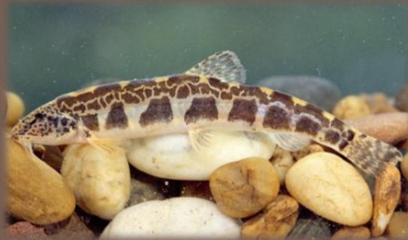
Píž vrchovský ( Sabanejewia balcanica )