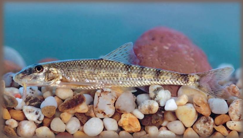
Hrúz fúzatý – celoročne chránený! - (fúzy až po žiabre a zväčšenejšie)