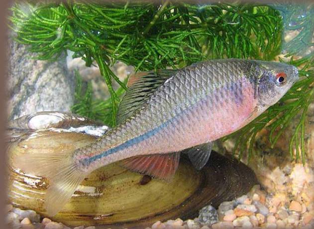
Lopatka dúhová ( Rhodeus amarus )