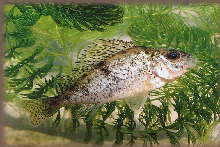
Hrebenačka vysoká (Gymnocephalus baloni)