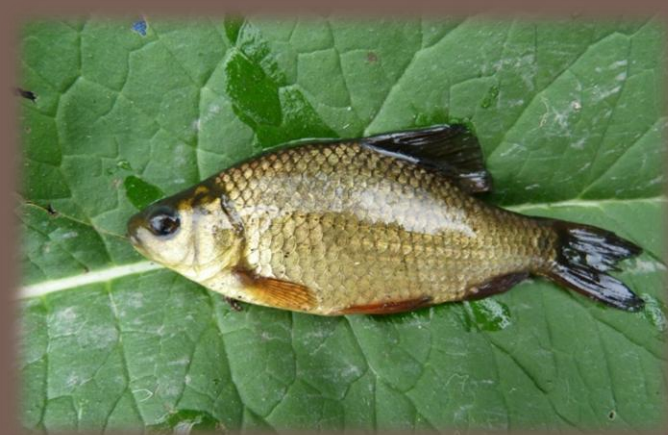
Karas zlatistý ( Carassius carassius )