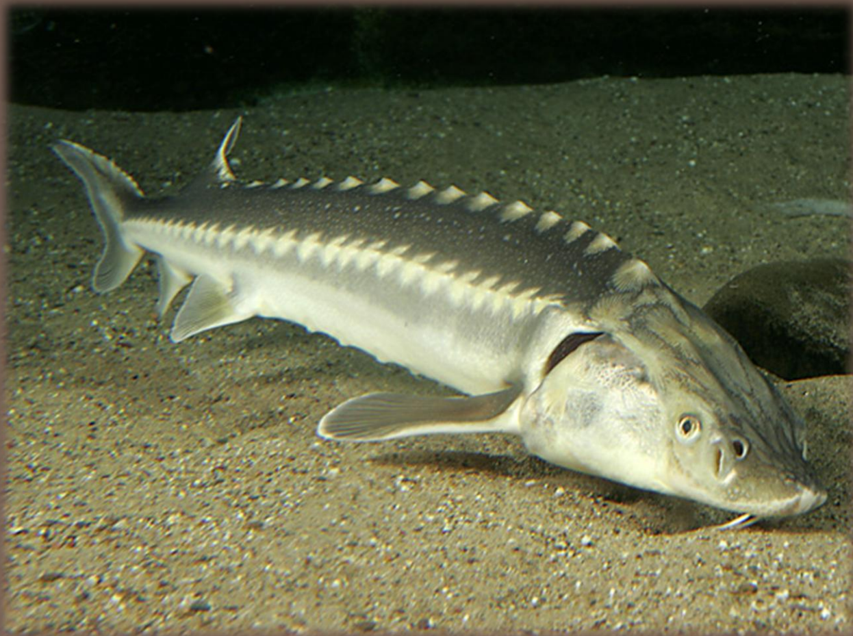
Jeseter ruský ( Acipenser gueldenstaedtii )