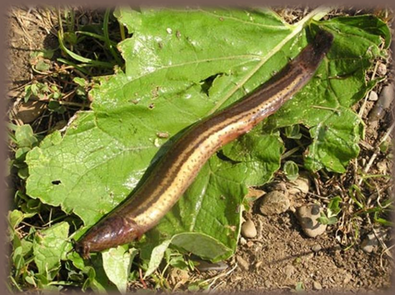
Čík európsky ( Misgurnus fossilis )