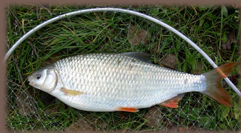
Plotica lesklá ( Rutilus pigus )