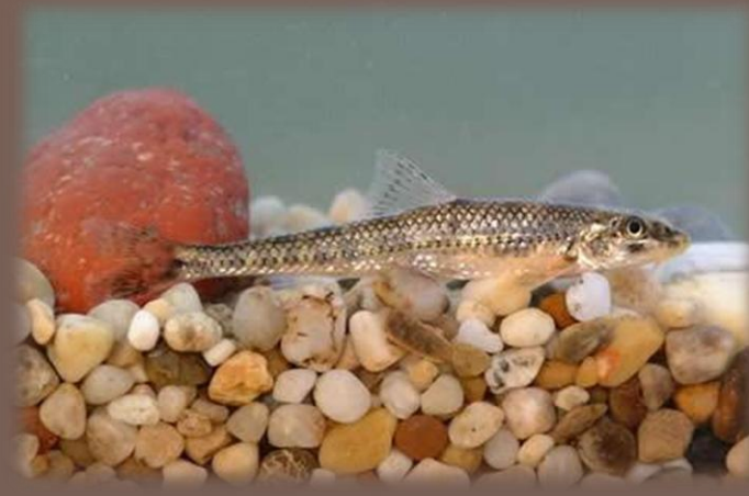
Hrúz Kesslerov – celoročne chránený! - (nemá šupiny na hrdle, fúzy po oči)